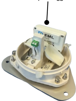
rejestrator danych Limpet Logger

Deszczomierze Kalyx-RG współpracują ze wszystkimi standardowymi rejestratorami danych, np. Solinst Rainlogger lub dedykowanym rejestratorem Limpet Logger firmy EML, który montowany jest wewnątrz deszczomierza .